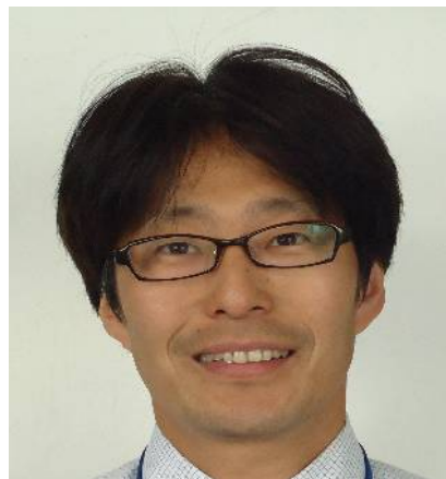
いしかわ せんせい