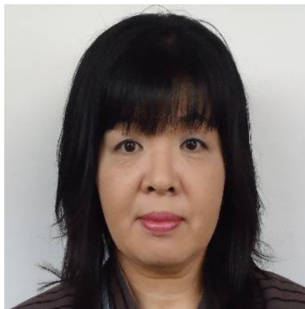
なかいきょうとうせんせい