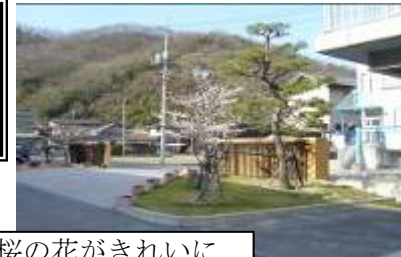
校門 松の隣の桜の花がきれいに咲いて人々を迎えています。