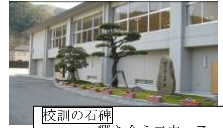
校訓の石碑 ~響き合う二中っ子~