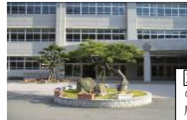
玄関 玄関先の真ん中の立派な松。みんなの成長を見守ります。