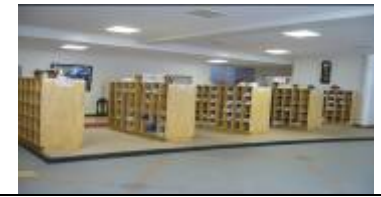
下駄箱 きれいにそろった靴そろえ。来客が感動されます。